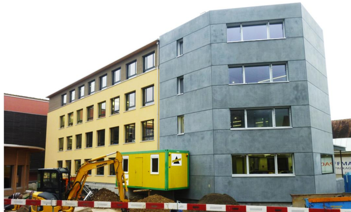
Aussenfassade während Umbau

Architekt W. Thommen Architekten AG Baslerstrasse 98 4632 Trimbach