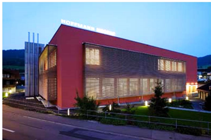
Gebäude nach der Sanierung