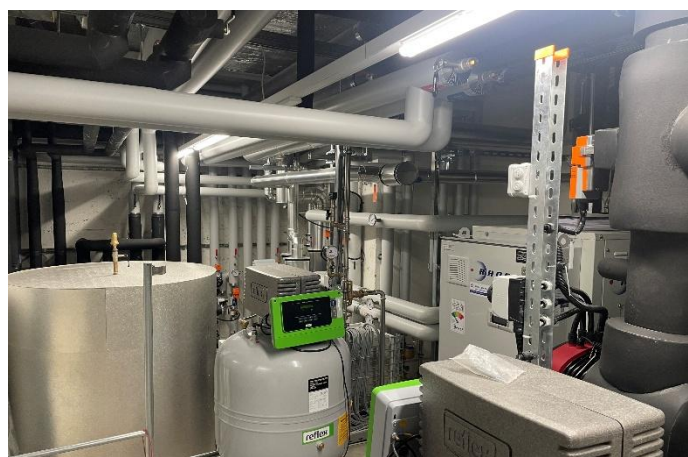
Technikzentrale im 2.UG