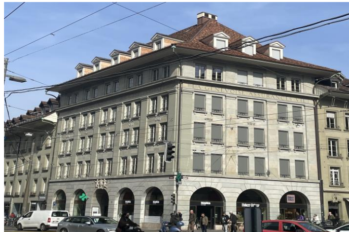
Bollwerk 15 Aussenansicht

Heizen, Kühlen, Lüften im denkmalgeschützten Gebäude. Lüftung via zentrale Steigzonen und aktiven Überströmelementen, damit keine Lüftungskanäle in den Geschossen geführt werden mussten. Heizen/Kühlen via Chance-Over und Heizkörper mit Ventilatoren.